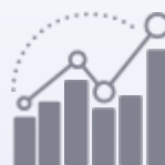
Auswertung und Optimierung