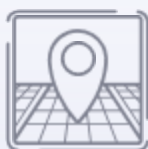
2D/3D Ortung & Navigation (± 10cm Genauigkeit)