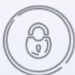
eKanban und Pull Versorgung