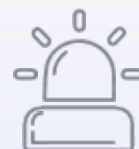
Geofence Zonen-getriggerte Alarm Events